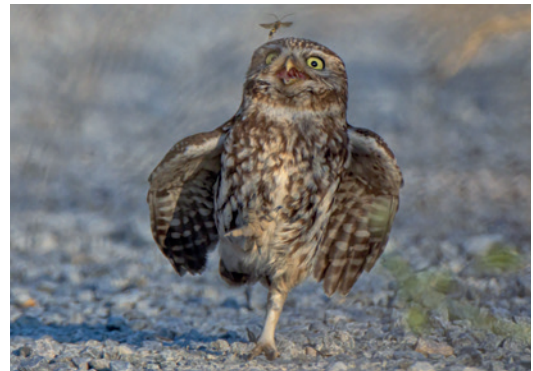
Steinkauz beim Futterfang