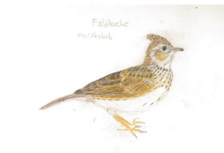
Zeichnung © Anton Krüger