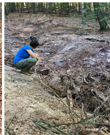
Kistbrünncchen nach Renaturierung