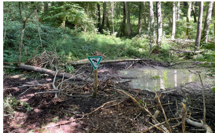
7 Quellen nach Renaturierung