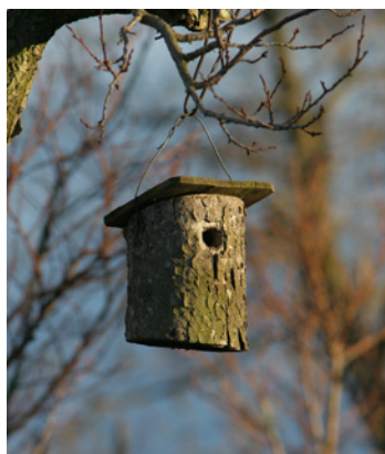
Nistkasten, © Foto: Zdenek Tunka, LBV Bildarchiv