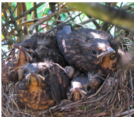
Amselnest, © Foto: Birgit Helbig, LBV Bildarchiv

Doch auch, wer selbst keine Katze besitzt, wird die Räuber auf Samtpfoten regelmäßig im eigenen Garten antreffen können. Hier helfen katzensichere Rückzugsräume für Vögel wie dichte und dornige Hecken. Beim Aufhängen von Nistkästen sollte darauf geachtet werden, dass diese katzensicher sind. So helfen an Bäumen Katzenabwehrgürtel und ein steiles, glattes Dach; auch das Anbringen der Nisthilfen an Seitenästen, frei hängend (mittels Asthaken) oder in ausreichender Höhe an Fassaden erhöht die Sicherheit. Wer Ganzjahresfütterung anbietet, kann darauf achten, dass es im direkten Umfeld des Futterplatzes kein Versteck für lauernde Vierbeiner gibt.