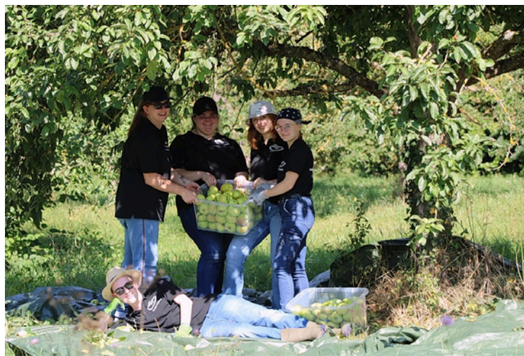
Teammitglieder der Schülerfirma

Ich selbst war letztes Jahr auf der Jahreshauptversammlung des LBV (MSP) mit zwei Kästen dabei. Dort konnte ich einiges über unsere Schülerfirma erzählen: Wie es dazu kam, was das genau ist, die Ernte, was im Hintergrund passiert ist, unsere Sponsoren, die Verkaufsstellen und zu guter Letzt die Verbindung zum LBV.