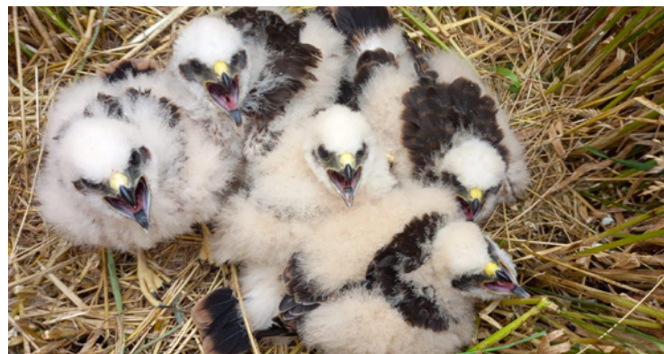
Wiesenweihen, Jungvögel, © Foto: L. Vieth

„... in einigen Landkreisen wurden Rekordzahlen bei den Brutpaaren oder flüggen Jungvögeln erzielt.“