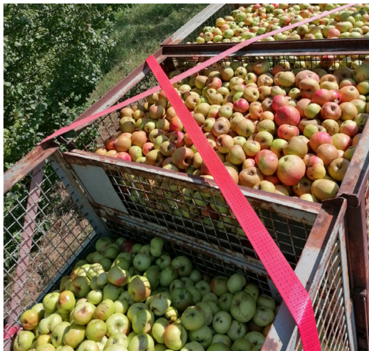
Äpfel der Schülerfirma