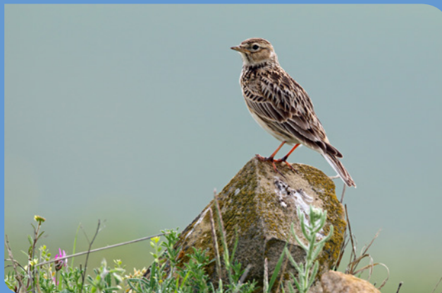
Feldlerche auf Stein, © Foto: Frank Derer, LBV Bildarchiv

Aschaffenburg-Miltenberg: Im Rahmen von ornithologischen Beobachtungen in den letzten Jahrzehnten fällt auch am Untermain der drastische Rückgang der Feldvögel auf – allen voran das Rebhuhn, aber auch zuvor häufige Arten wie die Feldlerche. Mit einem Glücksspiralenprojekt wird der ornithologische Arbeitskreis der LBV-Regionalgruppe Aschaffenburg-Miltenberg 2024 in beiden Landkreisen Feldlerchenerfassungen durchführen, um gezielt Restvorkommen und Schwerpunktgebiete ausfindig zu machen. Das Projekt dient als Vorbereitung für weitere, gezielte Schutzmaßnahmen.