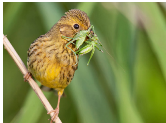
Goldammer mit Heuschrecke