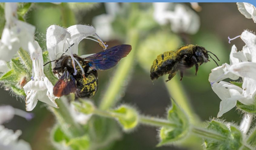
Große Holzbiene an Silbersalbei, © Foto: Erich Obster, LBV Bildarchiv