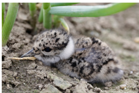
Kiebitz Küken, © Foto: Ralph Sturm, LBV Bildarchiv

Die Wahl zu Vogel des Jahres hat dieses Mal dem Kiebitz, Vanellus vanellus, den Titel verliehen. Falls ihr eine Veranstaltung zum diesjährigen „Vogelkönig“ anbieten wollt, stellt der LBV gerne eine Powerpoint-Präsentation zur Verfügung. Ihr findet sie im internen Sharepoint-Bereich unter Öffentlichkeitsarbeit/Vogel des Jahres oder auf Nachfrage bei eurer Ehrenamtsbeauftragten!