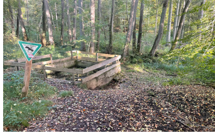
7 Quellen vor Renaturierung