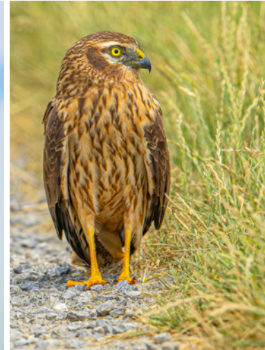
Wiesenweihen, Bad Kissingen, © Fotos: Stefan Deinzer