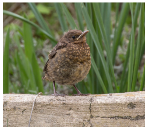
Junge Amsel, © Foto: Ralph Sturm, LBV Bildarchiv

„Beim Aufhängen von Nistkästen sollte darauf geachtet werden, dass diese katzensicher sind.“